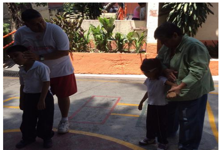
Alumnos de Audición y Ciegos del CAM 8